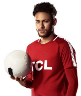
Ambasador de brand Neymar Jr.